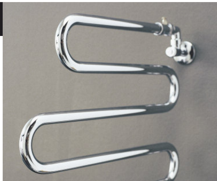
Calorifer Cromat (cod. 50)

Este disponibil în varianta cromată (din alamă) și în două modele. Dimensiuni (mm): 450xh325 și 550xh525.