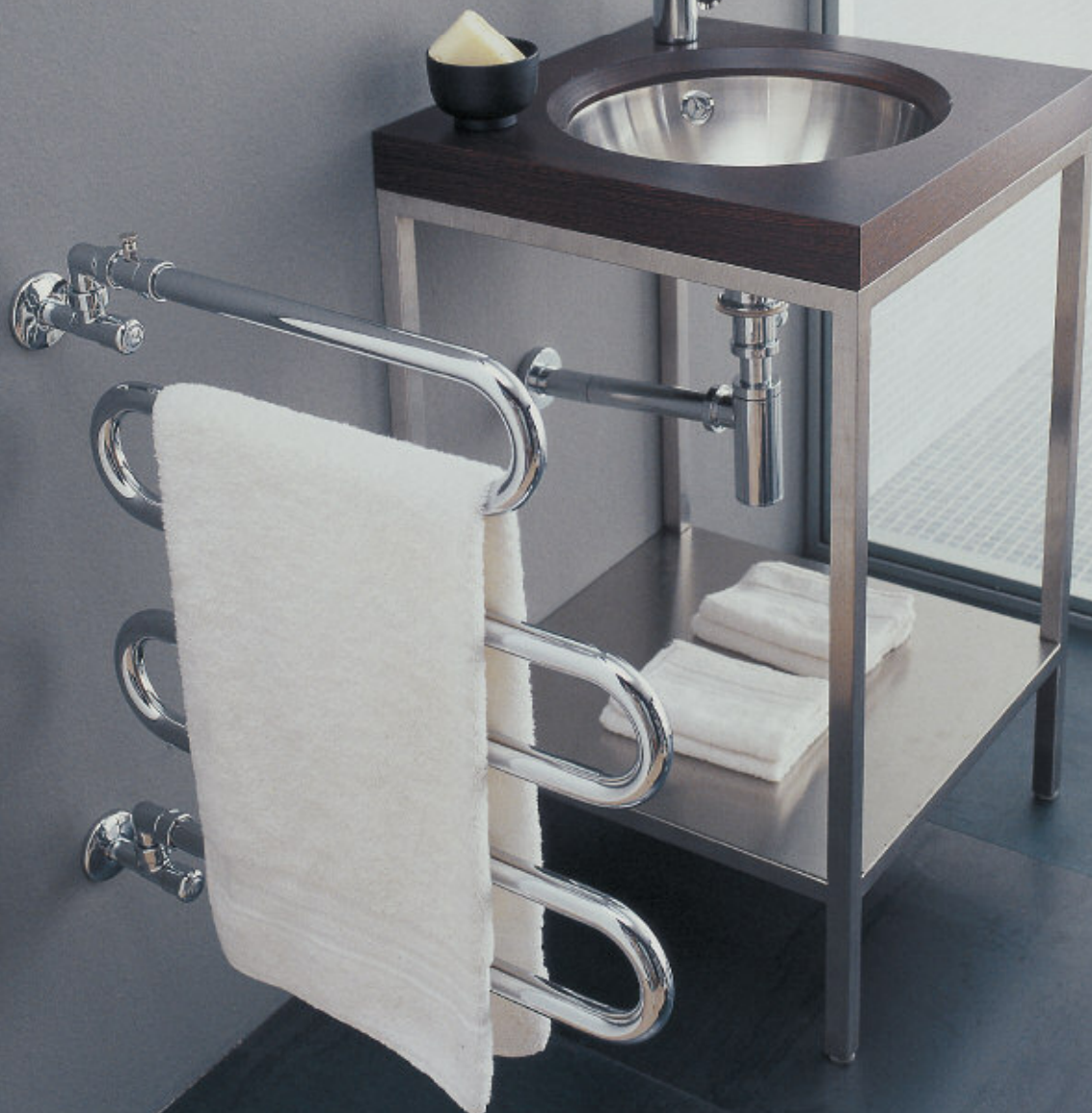
Calorifer Cromat (cod. 50)